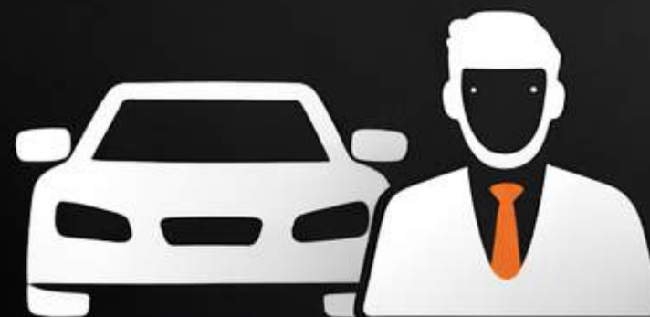
Прокат авто з водієм