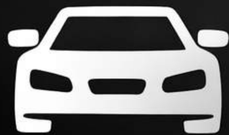
Прокат авто без водія