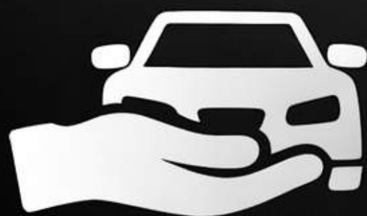
Оренда авто з правом викупу