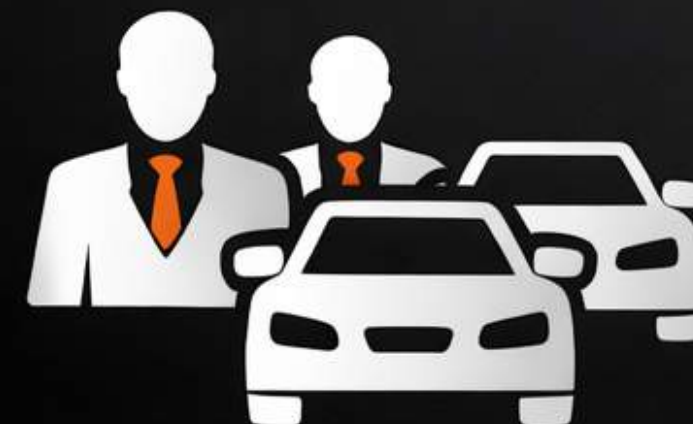
Прокат авто для корпоративних клієнтів (B2B)