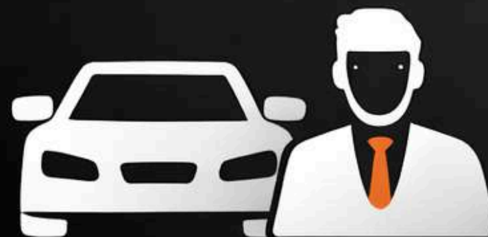
Прокат авто з водієм