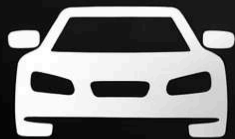
Прокат авто без водія