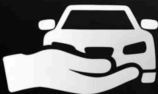
Оренда авто з правом викупу