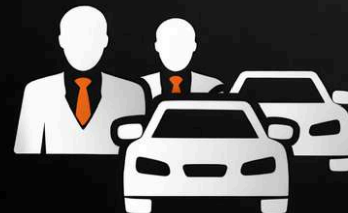
Прокат авто для корпоративних клієнтів (B2B)